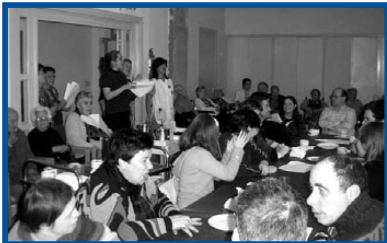
N.L. Legazpi.- Jóvenes de Atzegi en la Residencia Sª Cruz, corazón de la villa del Alto Urola. ¡Así trabaja Nagusilan!

Bien que anden por ahí las empresas esforzándose por obtener la Q de calidad ... En NAGUSILAN , cada uno de sus miembros pretendemos merecer no menos que la calificación de buena persona : sincera, noble, generosa, bien intencionada, trigo limpio! Con ello estaremos ya influyendo positivamente sobre alguien -¿sobre muchos?-. Recordémoslo: ¡Influimos más por lo que somos que por lo que decimos o hacemos!