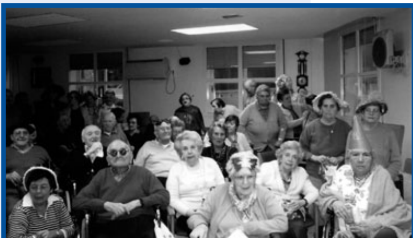
N.L. Elgoibar (20.02.07).- Carnavales en San Lázaro. Los residentes siguen con manifiesto interés las incidencias de la tómbola