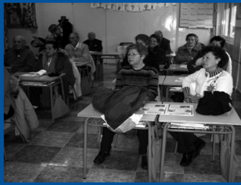
Los/las alumnos/as han crecido, pero sin que se haya rebajado ni tanto así su capacidad de atención a las palabras del conferenciante

Nutrida representación de NL. asistimos a la Misa de corpore in sepulto en la Iglesia de la Encarnación de Santa Fe (Granada). Descanse en paz.